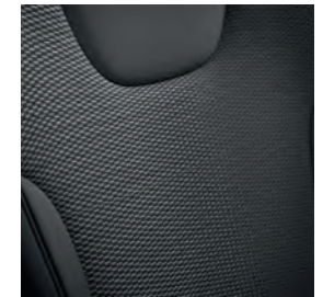
Tissu et cuir synthétique noir charbon