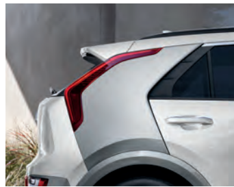
Blanc neige nacré, avec pilier C et garnitures latérales gris**

* Non disponible sur les versions Premium. ** Disponible uniquement sur la version Limitée. Certaines associations de peinture extérieure, de sellerie et de version peuvent être limitées. Veuillez visiter kia.ca pour obtenir tous les détails.