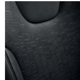
Cuir synthétique noir charbon