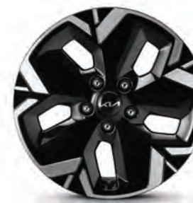
Jantes en alliage de 17 po