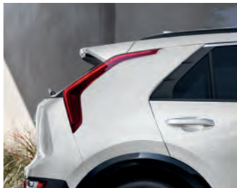
Blanc neige nacré