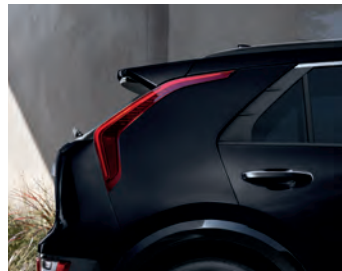
Noir aurore nacré