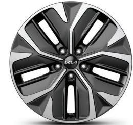
Jantes en alliage de 19 po