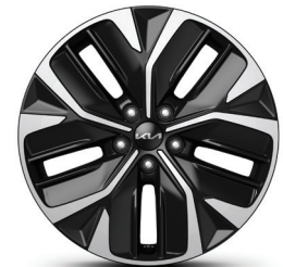
Jantes en alliage de 19 po - GT-Line groupe 1