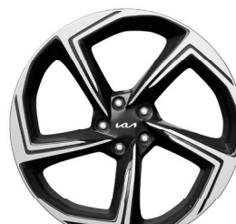
Jantes en alliage de 21 po - GT