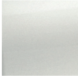
Blanc neige nacré