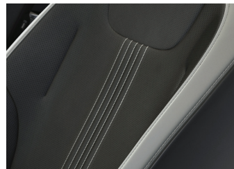
Suède et cuir synthétique noirs