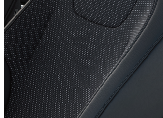
Tissu et cuir synthétique noirs