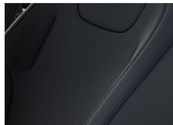
Cuir noir (synthétique)