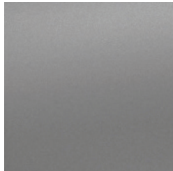
Gris acier mat**

* Non disponible sur les groupes GT-Line ou sur les versions GT.