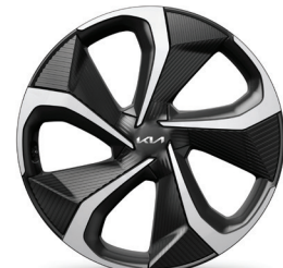
Jantes en alliage de 20 po - GT-Line groupe 2