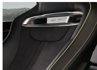
Suède GT et cuir synthétique