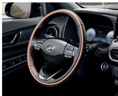
Volant chauffant livrable