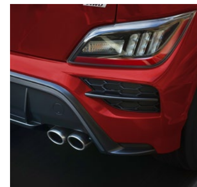
Échappement à deux embouts livrable