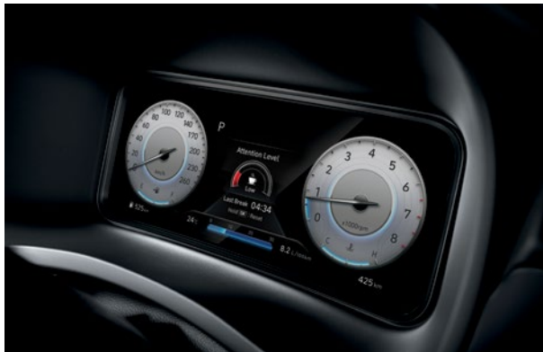
Panneau d'instrumentation entièrement numérique de 10,25 po livrable

Une course à faire à l'autre bout de la ville? Une fringale de fin de soirée? Déplacez-vous sans problème grâce à ces caractéristiques impressionnantes.