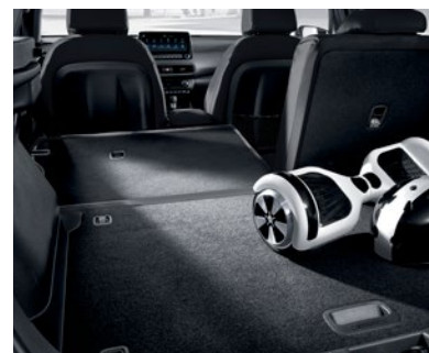
Sièges arrière rabattables 60/40 de série