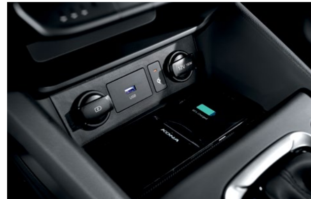
Chargeur sans fil T livrable