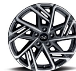
Jantes en alliage de 18 po De série sur la version N Line et la version N Line avec ensemble Ultimate