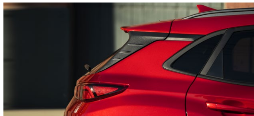
Feux arrière à DEL livrables Déflecteur arrière de série