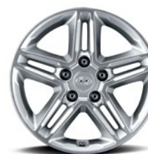
Jantes en alliage de 16 po De série sur la version Essential