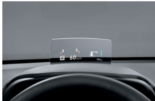
Affichage tête haute livrable