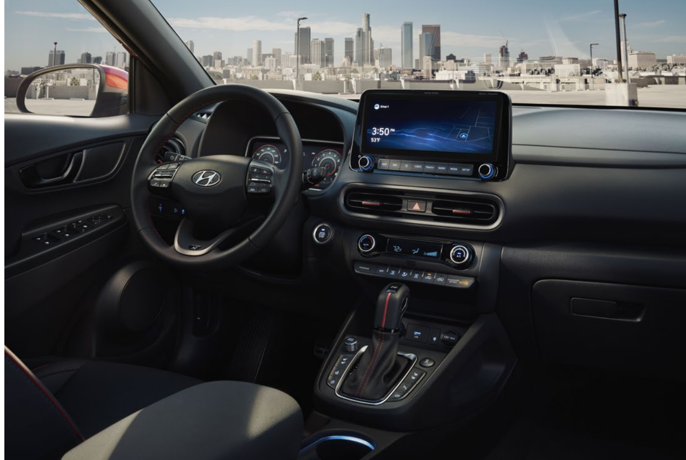
Version N Line avec ensemble Ultimate montrée.

À l'extérieur, le KONA nouvellement redessiné fait preuve d'audace. À l'intérieur, il vous propose un niveau de confort exceptionnel et un large éventail de caractéristiques. Le nouveau KONA pense à votre bien-être avec ses sièges avant chauffants de série, un volant chauffant livrable et un siège conducteur à réglage électrique en 8 directions livrable. Et lorsque le temps chaud est au rendez-vous, les sièges avant ventilés livrables du KONA sauront vous garder au frais.