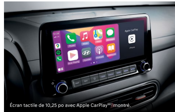
Écran tactile de 10,25 po avec Apple CarPlay MC montré.