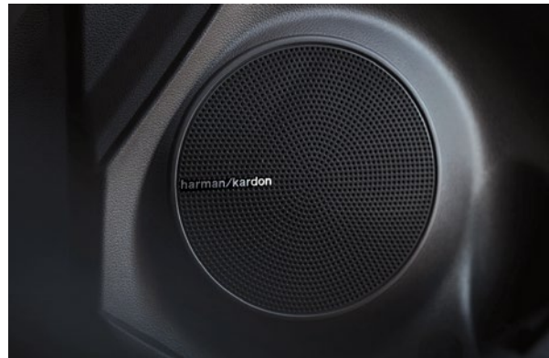
Chaîne audio harman/kardon MD* haut de gamme avec 8 haut-parleurs livrable