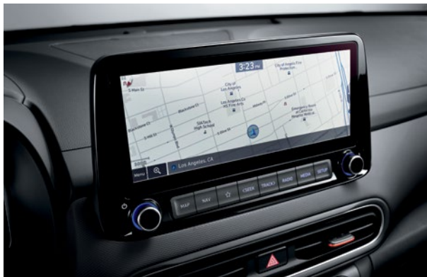
Écran tactile de 10,25 po avec système de navigation livrable