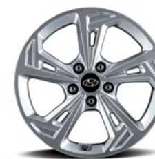
Jantes en alliage de 17 po De série sur la version Preferred