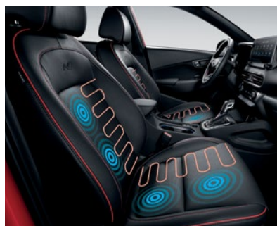
Sièges avant chauffants de série Sièges avant ventilés livrables