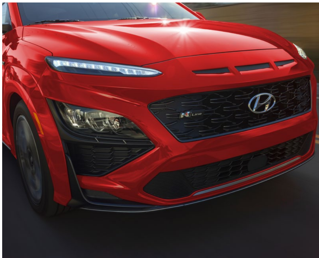
Phares de jour à DEL de série Phares à DEL livrables

Le nouveau KONA se caractérise par une calandre au design distinctif qui s'intègre harmonieusement aux phares redessinés. Le style saisissant des phares de jour à DEL étroits de série demeure un trait caractéristique et incontournable de la conception. Le design audacieux est renforcé par des détails d'habillage de la carrosserie le long des passages de roue et du pare-chocs arrière.