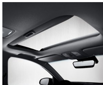
Toit ouvrant électrique livrable