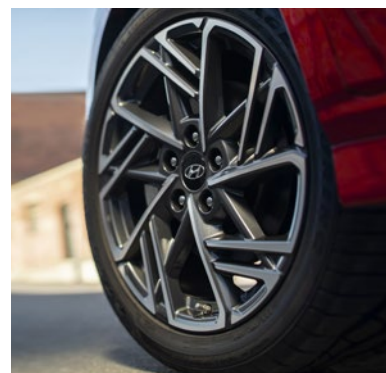
Jantes en alliage de 18 po livrables