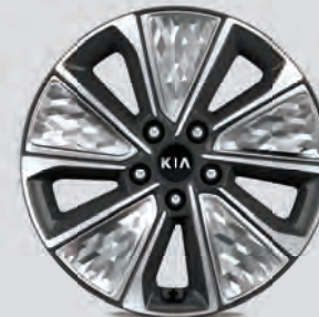
Jantes en alliage de 17 po