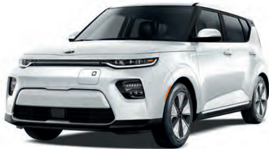
Blanc neige nacré