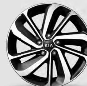
Jantes en alliage de 18 po