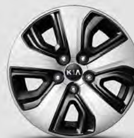
Jantes en alliage de 16 po avec enjoliveurs