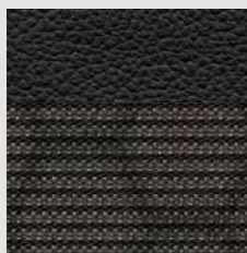
Tissu et cuir noirs