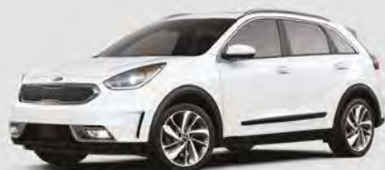
Blanc neige nacré