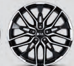
Jantes en alliage usiné de 19 pouces