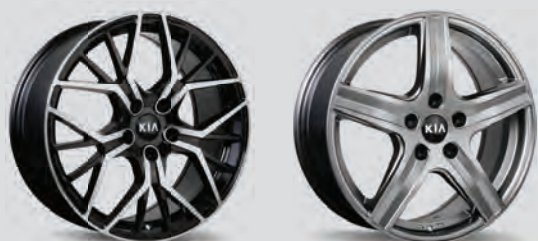
Choix de jantes

La disponibilité des accessoires peut varier. Veuillez demander tous les détails à votre concession. Images à titre d'illustration uniquement.