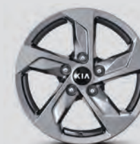
Jantes en alliage de 16 po