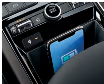
LE CHARGEUR SANS FIL 1,3 vous permet de garder votre téléphone intelligent toujours chargé sur la route