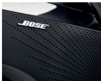
LA CHAÎNE AUDIO DE LUXE BOSE 1,10 inclut 12 haut-parleurs haute performance et le son ambiophonique