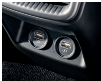
CINQ PORTS USB 1 sont répartis dans l'habitacle pour que tout le monde puisse charger ses appareils