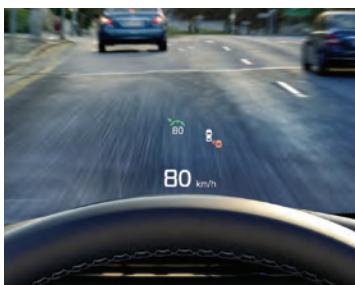
L'AFFICHAGE TÊTE HAUTE (HUD) 1 projette discrètement des informations de conduite importantes sur votre pare-brise, afin que vous gardiez toujours les yeux sur la route