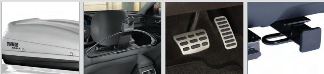
Boîtier de chargement de toit

Les accessoires de marque Kia sont conçus pour se positionner parfaitement, fonctionner correctement et sublimer votre véhicule