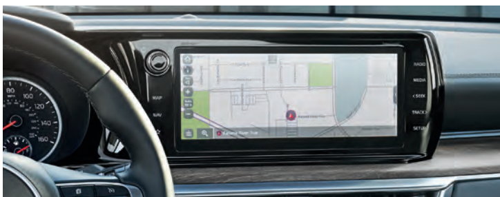
L'INTERFACE MULTIMÉDIA DE 10,25 PO 1,4 inclut un navigateur intégré à écran tactile

Vous êtes toujours en contrôle grâce à ces caractéristiques haut de gamme offertes de série et en option.