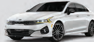
Blanc glacial nacré