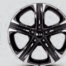
Jantes en alliage usiné de 18 pouces (noir)