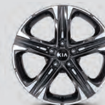
Jantes de 18 po en alliage usiné (graphite)