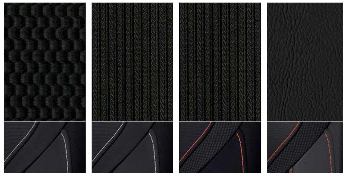
Tissu charbon de bois S