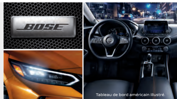
Tableau de bord américain illustré.