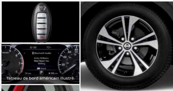
Tableau de bord américain illustré.