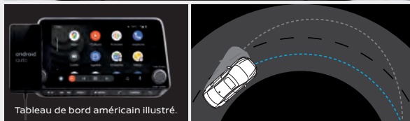
Tableau de bord américain illustré.