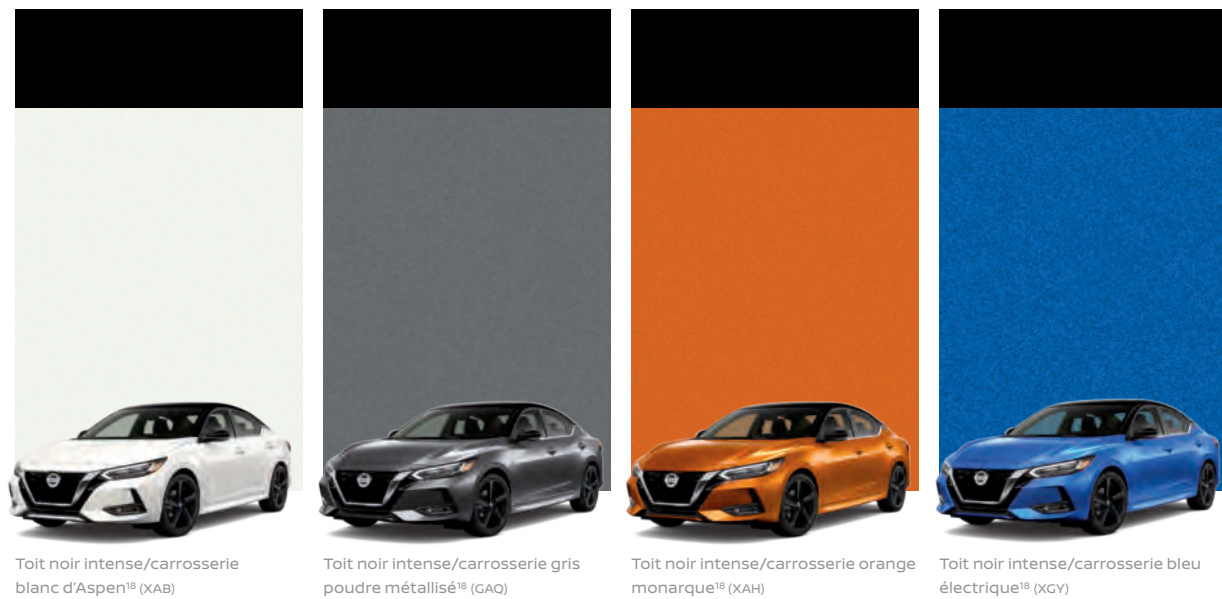
Toit noir intense/carrosserie blanc d'Aspen 18 (XAB)