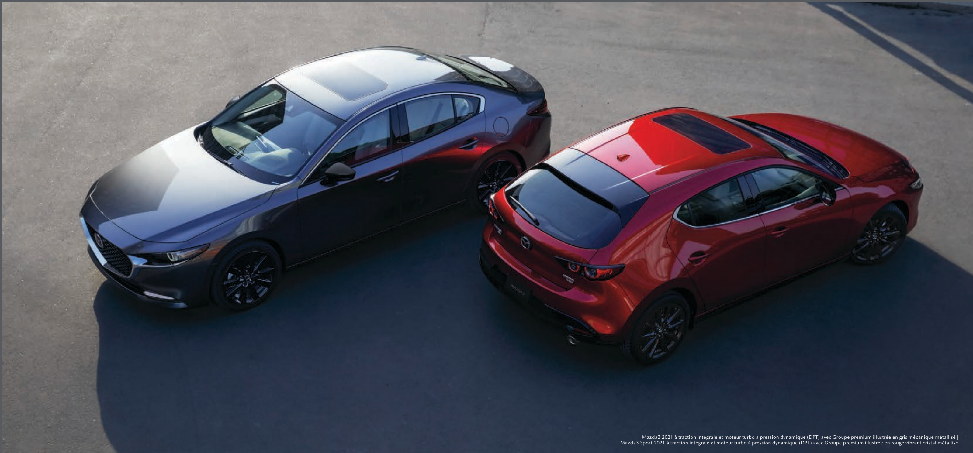
Mazda3 2021 à traction intégrale et moteur turbo à pression dynamique (DPT) avec Groupe premium illustrée en gris mécanique métallisé | Mazda3 Sport 2021 à traction intégrale et moteur turbo à pression dynamique (DPT) avec Groupe premium illustrée en rouge vibrant cristal métallisé