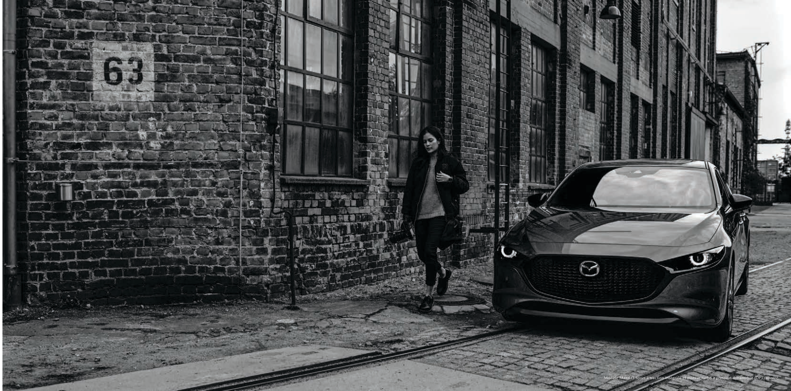
Modèle Mazda3 Sport à traction intégrale et moteur turbo à pression dynamique (DPT) illustré.