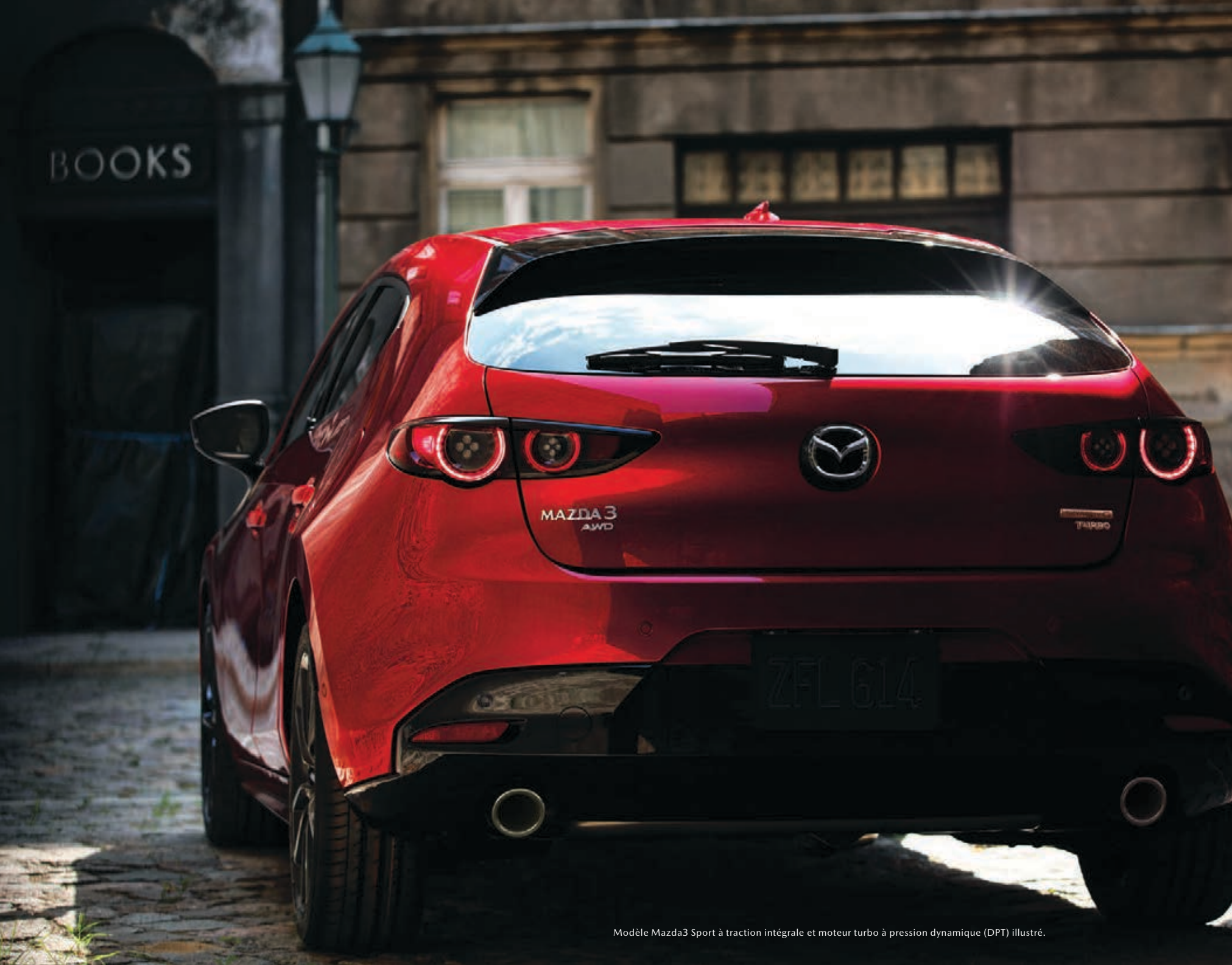
Modèle Mazda3 Sport à traction intégrale et moteur turbo à pression dynamique (DPT) illustré.

Le design élevé au rang d'œuvre d'art est capable de nous émouvoir. Physiquement et émotionnellement. Il peut provoquer une réaction – et vous faire ressentir quelque chose. Voilà ce qu'est la Mazda3 Sport : une séduisante sportive à hayon, à l'image de notre grande minutie. Nos artisans passionnés insufflent de l'énergie dans tout ce qu'ils touchent. Un design évocateur et mûrement réfléchi, telle est notre philosophie – et la seule qui nous guide lorsque nous créons nos Mazda.