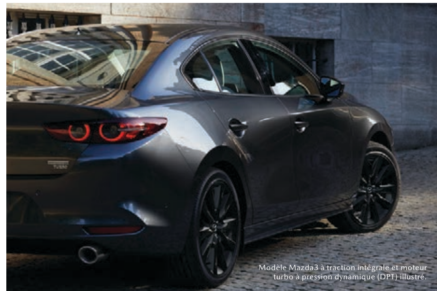
Modèle Mazda3 à traction intégrale et moteur turbo à pression dynamique (DPT) illustré.