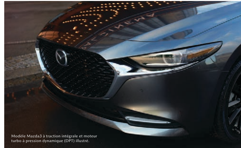
Modèle Mazda3 à traction intégrale et moteur turbo à pression dynamique (DPT) illustré.